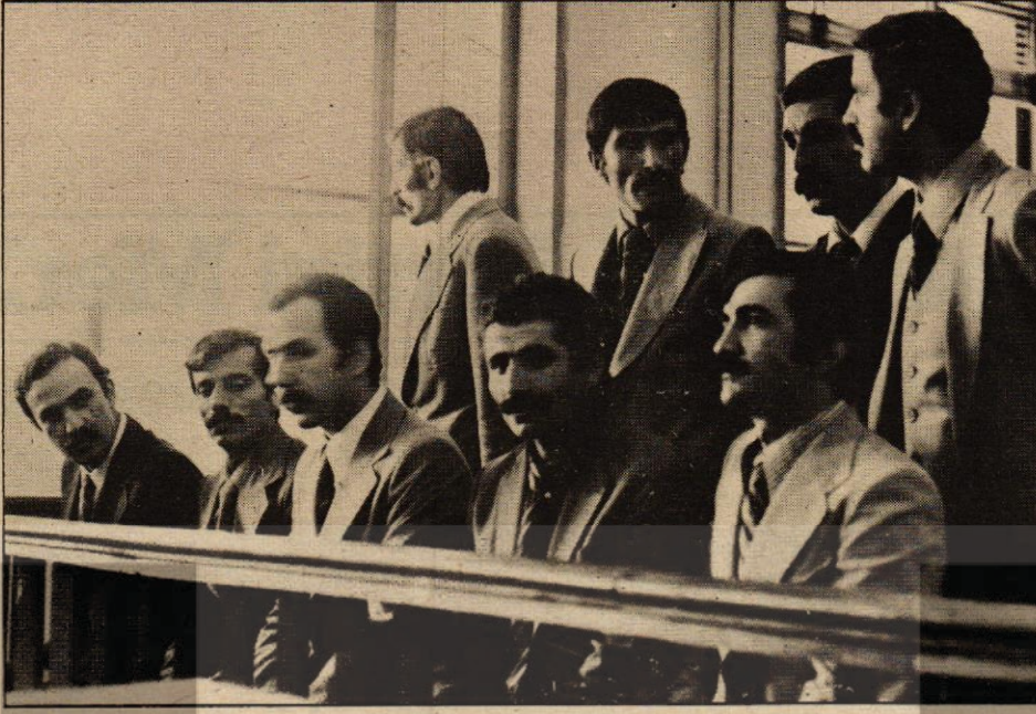
TSİP Genel Yönetim Kurulu üyeleri önceki duruşmada

Önceki duruşmalarda TCK'nun 142. maddesinin Anayasaya aykırı olduğu yolunda, avukatlar tarafından yazılı görüş bildirilmiş, bu konuda mahkeme, konu Anayasa Mahkemesinde olduğundan bir karar vermemiştir. Anayasaya aykırılık hakkında görüşü sorulan