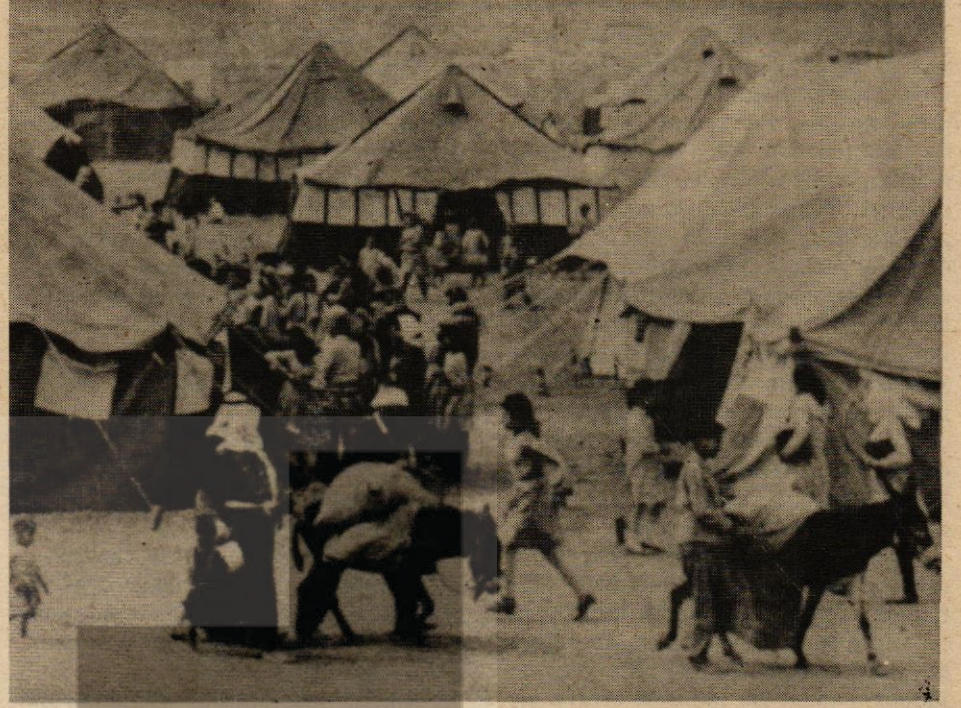
Filistin halkı değişik ülkelerde çoğunlukla göçmen kamplarında yaşamını sürdürmeye çalışıyor. Fotoğrafta Amman'daki Filistin göçmen kampı görülüyor.

«5 — Filistin devrimi güçlerine bağımsızlıklarını koruma temelinde Filistin Arap halkının evlerine dönme, kendi kaderini tayin, bağımsız ulusal devletini kurma ve meşru ulusal haklarının tam olarak tanınması için, bu halkın tek meşru temsilcisi Filistin Kurtuluş Örgütü'nün önderliğinde yürüttükleri mücadelede şimdiki potansiyeli korumaya ve güçlendirmeye yardımcı olacak; Filistin Arap halkının bağımsız ulusal kişiliğini ifade eden politik kararların kabul edilmesi için tam politik, maddi ve