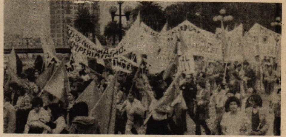
Meksika'da Nikaragua halkıyla dayanışma gösterisi. Somoza diktatörlüğüne karşı verdiği mücadelede, Nikaragua halkı dünyanın tüm ilerici, demokrat, sosyalist güçlerinden destek gördü.

Leon kentini Nikaragua'nın geçici başkent ilan eden yeni hükümet yönetimin ilkelerini açıkladı. Buna göre ulusal muhafızların dağıtılacağı, bunun yerine Sandinista savaşıçılarının ve Somoza muhalifi ve diktatör-